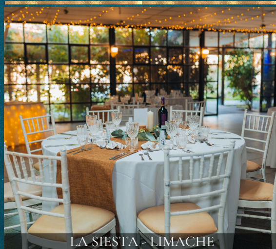
LA SIESTA - LIMACHE