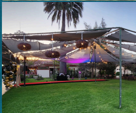
EASTMAN - ÓLMUE